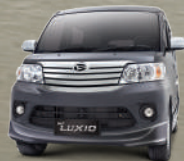
Dark Grey Metallic