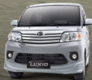
Classic Silver Metallic