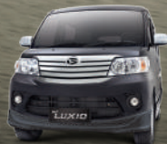
Midnight Black Metallic