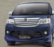
Sonic Blue Metallic